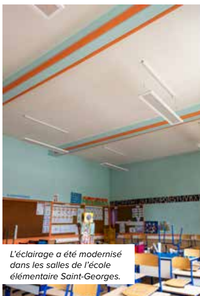
L'éclairage a été modernisé dans les salles de l'école élémentaire Saint-Georges.