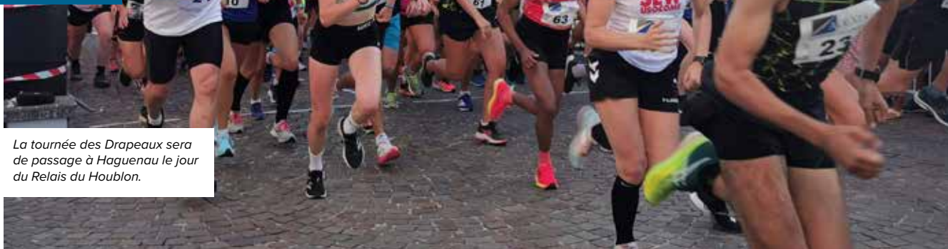
La tournée des Drapeaux sera de passage à Haguenau le jour du Relais du Houblon.