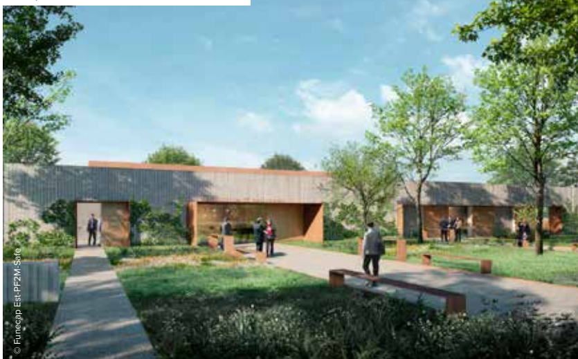
Perspective de l'entrée du crématorium.

La rue de la Filature a été aménagée depuis quelques mois par l'installation d'un double-sens cyclable provisoire. De nombreux avis positifs d'utilisateurs conduisent à pérenniser ce système.