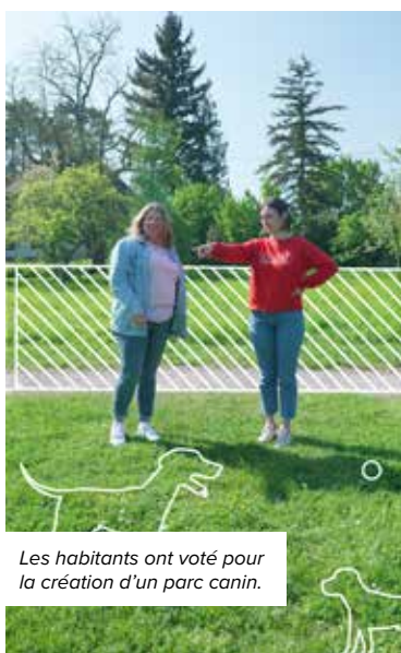
Les habitants ont voté pour la création d'un parc canin.

Pour la troisième année consécutive, la Ville de Haguenau a alloué aux habitants une enveloppe financière pour réaliser des projets d'intérêt général qui leur tiennent à cœur. Cette initiative vise à valoriser la citoyenneté active et à associer les habitants à la décision publique . Et vous avez été près de 900 à exprimer vos votes lors du Budget participatif 2023 !