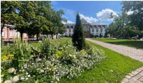
Devant l'Hôtel de Ville, c'est la dominante blanche qui a été choisie, en forme de clin d'œil aux mariages qui y sont célébrés.