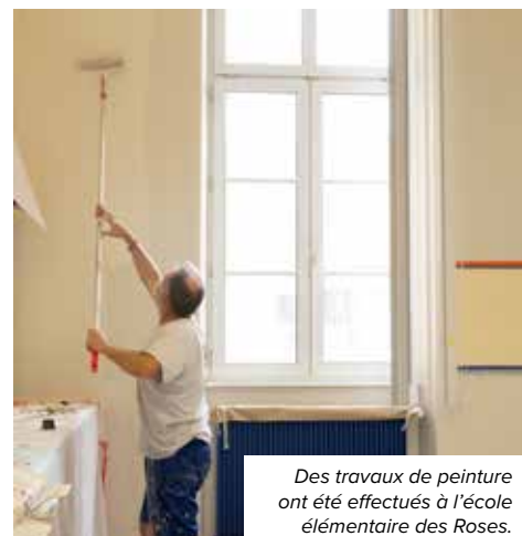
Des travaux de peinture ont été effectués à l'école élémentaire des Roses.

Autre investissement récent pour assurer la réussite éducative des enfants : l'Espace Numérique de Travail , mis en place et financé par la Ville de Haguenau avec le soutien de l'Éducation nationale. Cette plateforme met en relation les enseignants, les élèves des écoles élémentaires et leurs parents... Un outil qui permet de créer des contenus pédagogiques interactifs et de valoriser les activités réalisées en classe, et ainsi de faciliter la communication et d'impliquer davantage les parents dans la vie de l'école !