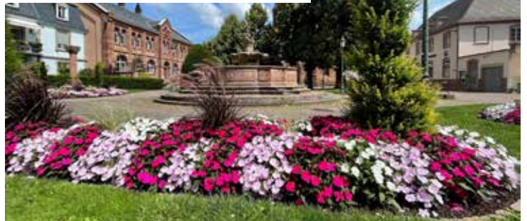
Devant l'église Saint-Georges, près de la fontaine aux abeilles, le violet domine, avec une touche de blanc pour adoucir ce camaïeu rosé.