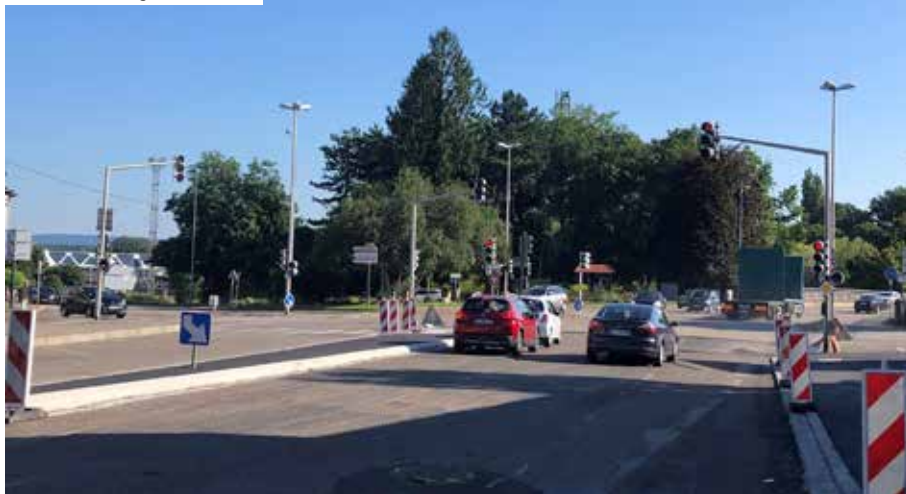
Travaux sur la voie d'accès de la route de Strasbourg vers la route de Schweighouse.

un nouveau square, avec notamment la plantation de nombreux arbres . Les travaux de voirie sont programmés à partir de fin août pour 4 mois environ, l'aménagement des espaces verts étant prévu pendant la période de plantation hivernale. Ce projet est né d'une large démarche de concertation menée avec les riverains .