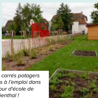
Des carrés potagers prêts à l'emploi dans la cour d'école de Marienthal !